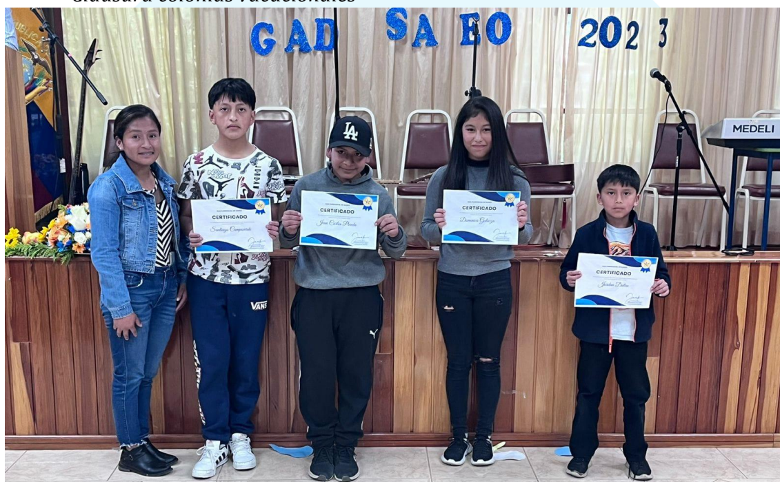
Figura 8 Clausura colonias vacacionales