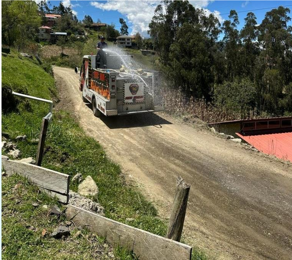
Figura 12 Mantenimiento vial