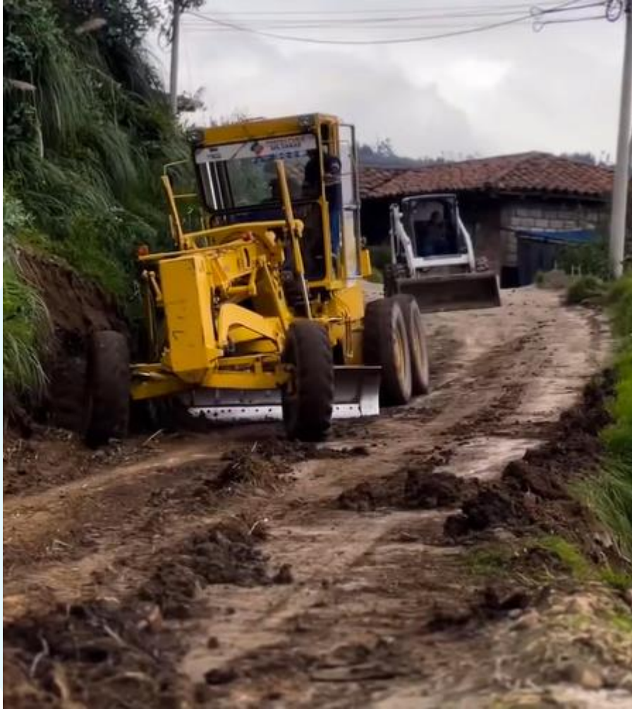
Figura 14 Mantenimiento vial