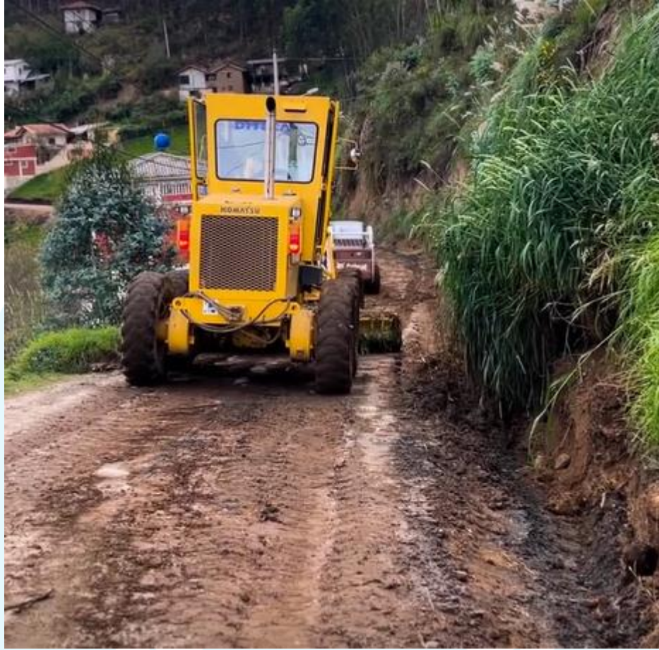
Figura 13 Mantenimiento vial