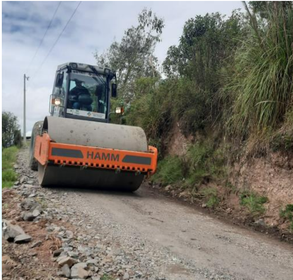
Figura 15 Mantenimiento vial